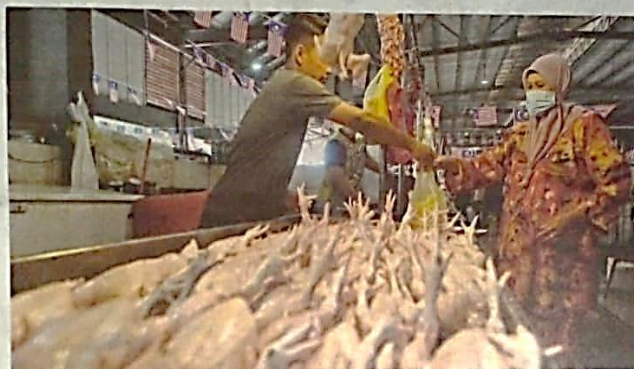
ORANG ramal membeli ayam segar di Pasar Chabang Tiga, Kuala Terengganu.

tindakan itu membebankan pengguna namun ayam kini menjadi pilihan utama susulan kenaikan melampau harga ikan sejak kebelakangan ini.