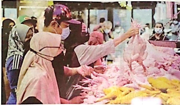
SKIM harga maksimum runcit ayam akan berakhir pada 30 Jun ini.

"Kalau kenaikan itu tidak munasabah, kita masih ada kuasa