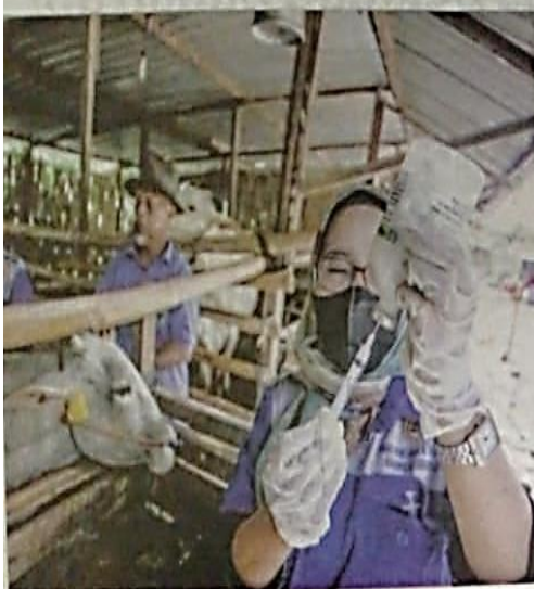
DOKTOR halwan dari Jabatan Pertanian dan Perikanan menyediakan dos vaksin FMD untuk lembu ternakan.